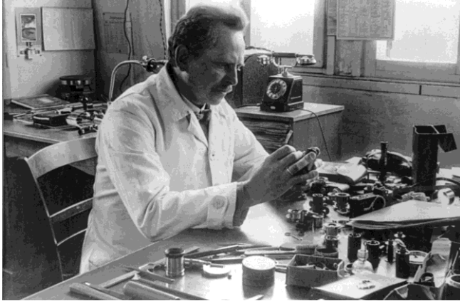
Oskar Barnack an seiner Werkbank, ca. 1933, Fotograf unbekannt.

Auf Wunsch senden wir Ihnen gerne Druckdaten (honorarfrei im Kontext einer Berichterstattung).