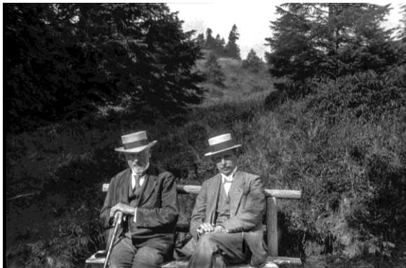
Ernst Leitz II. (links) und Oskar Barnack bei einem Spaziergang im Schwarzwald, ca. 1914, Fotograf unbekannt.

© mit freundlicher Genehmigung der Leica Camera AG