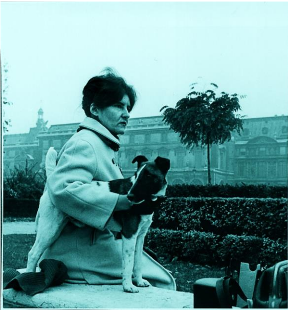
In Paris, um 1960.