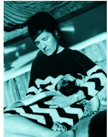
In Paris in den 1960ern.