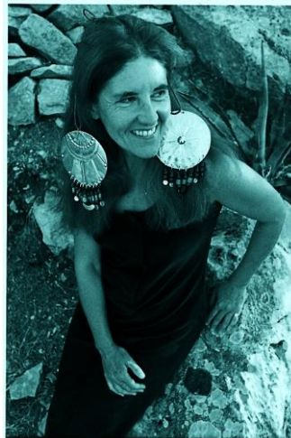
In Griechenland, um 1965.