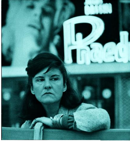
In Paris in den 1960ern.