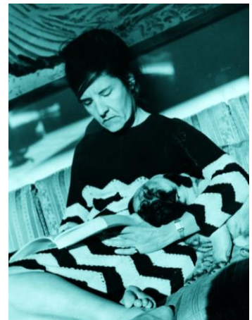
In Paris in den 1960ern.