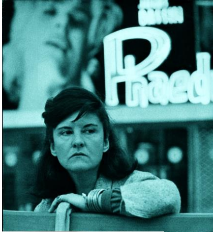
In Paris in den 1960ern.