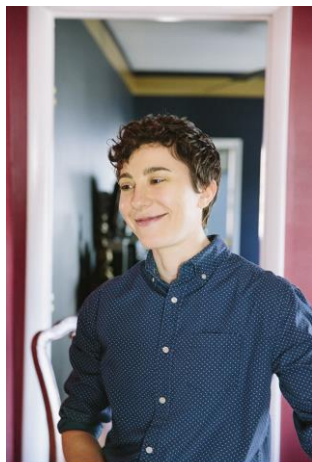
Stand: August 2019 honorarfreie Nutzung für Cover, Werbung, Presse, Internet (nicht für Lizenz- ausgaben!) Der Download von Autorenfotos sowie deren Abdruck oder das Einstellen auf Websites ist ausschließlich für Presse Zwecke und werbliche Maß- nahmen gestattet, die im direkten Zusammenhang mit einem bei dtv erschie- nenen Werk des Autors/der Autorin stehen. Der dem Bild angefügte Copyright-Hinweis ist zu nennen.