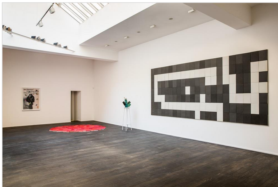
Installationsansicht »Short Story« Plutschow Gallery Zürich, 2015 © Peter Wüthrich, Foto: Plutschow Gallery