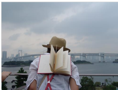
»The Angels of the World – The Angels of Tokyo« 2007 Fotografie / Fotoserie © Peter Wüthrich, Foto: Peter Wüthrich