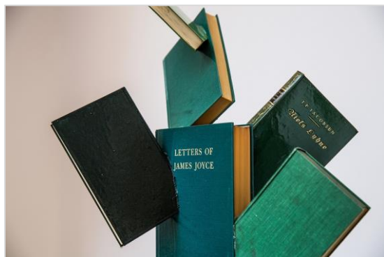
»Cactus succulentus literally«, 2015 (Detail) © Peter Wüthrich