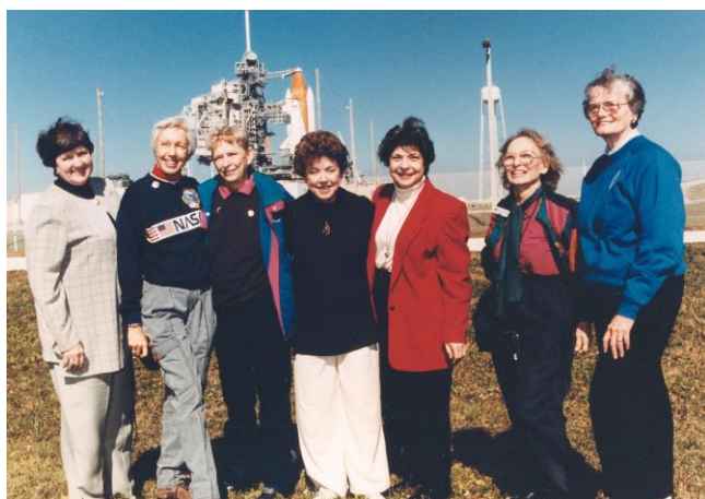
Sieben Teilnehmerinnen der „Mercury 13“, 1995.