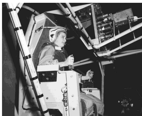
Jerrie Cobb beim Astronautentraining.

Auf Wunsch stellen wir Ihnen gern weiteres rechtefreies Bildmaterial zur Verfügung.