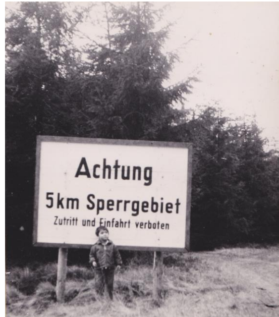
Aus dem Familienalbum: Naumann als Kind im Grenzgebiet in Thüringen.

Bis zur Wende wusste ich überhaupt nicht, dass der Rennsteig eigentlich viel länger ist. Dass er mehrmals die bayrische Grenze überquert und bis Blankenstein reicht. Ich habe noch alte Wanderkarten des Rennsteigs aus der Zeit meiner Kindheit: Die Karten waren einfach abgeschnitten worden, als hätte die Welt kurz vor der Grenze der DDR aufgehört.